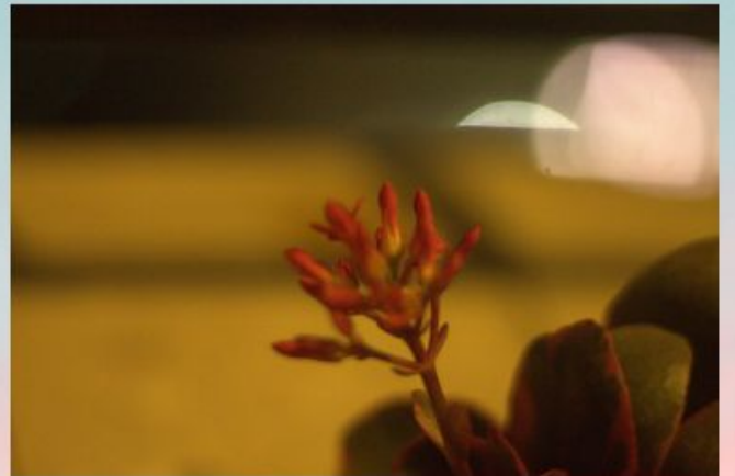
- Prakhar Drolia (9)