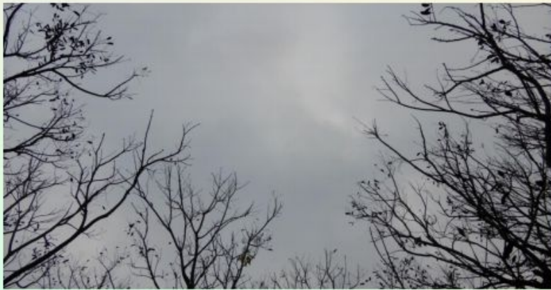
- Debsingha Sirkar (9)