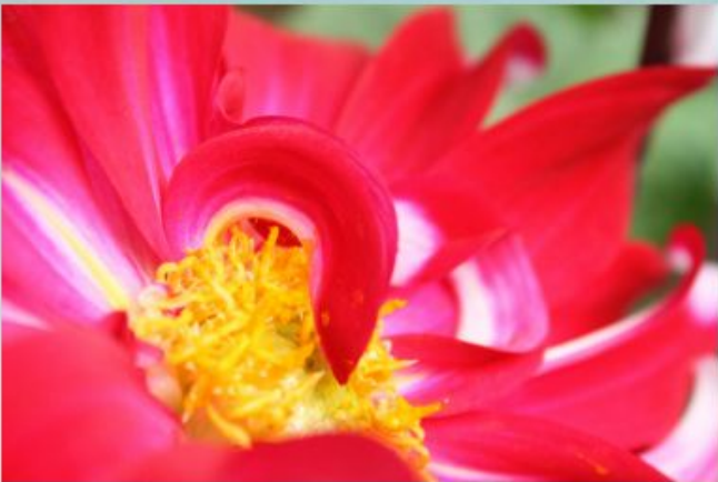
- Prakhar Drolia (9)