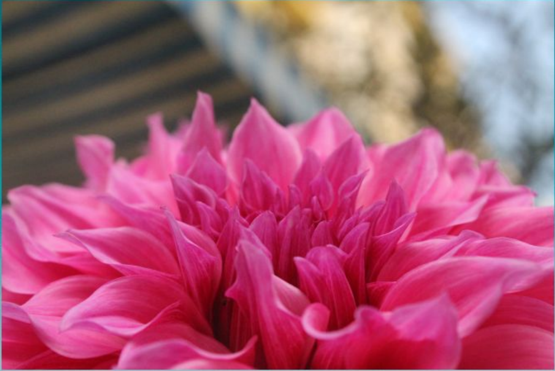
- Prakhar Drolia (9)