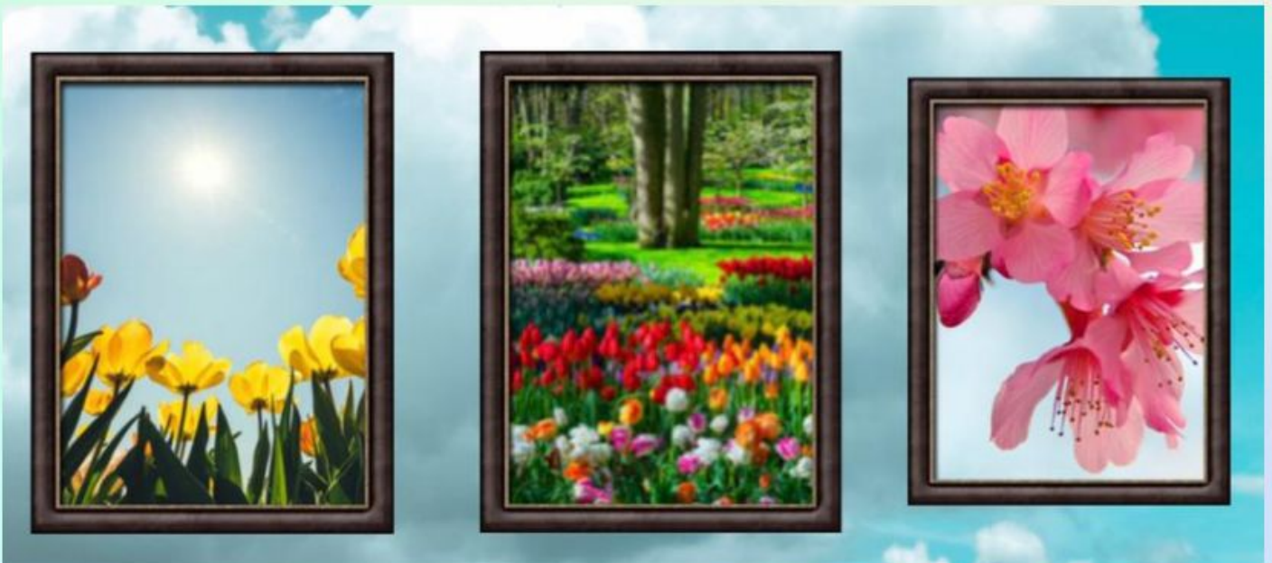
- Kaavin Raja (6)