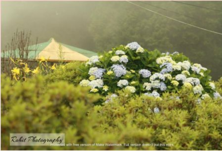
- Rohit Dey (7)